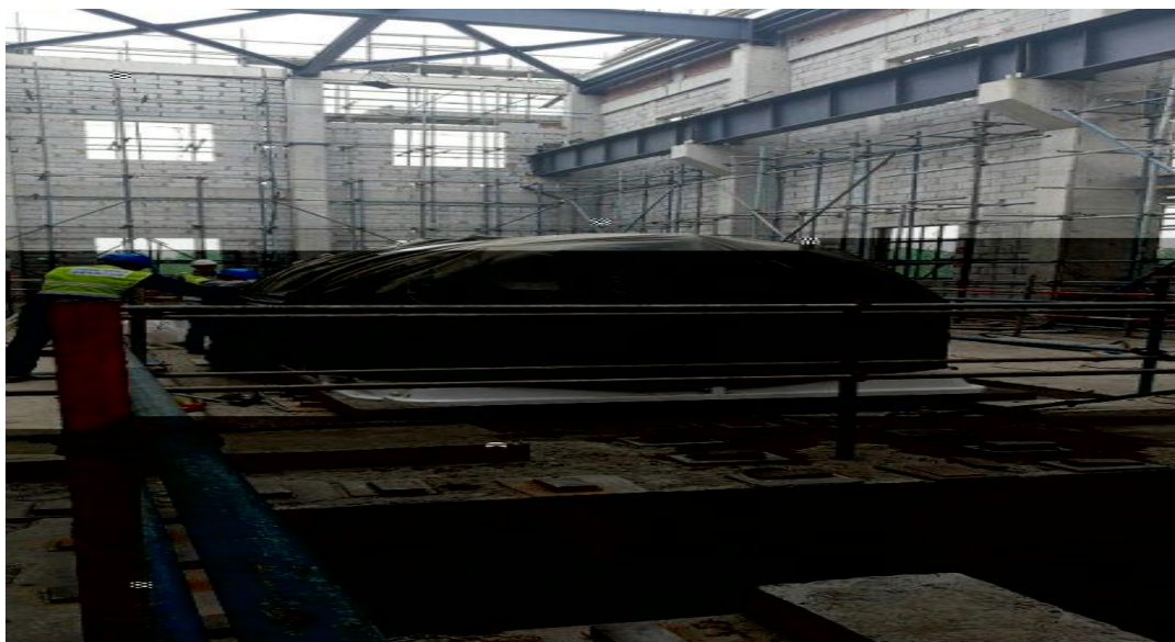
主厂房发电机定子吊装