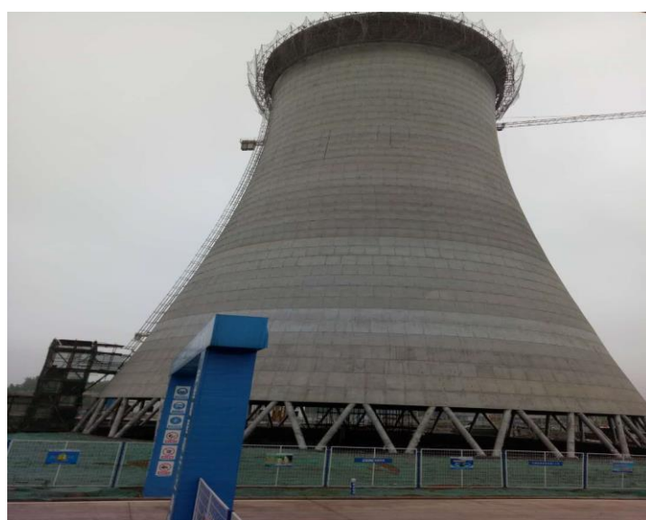
锅炉内部过热器穿墙安装 冷水塔四十四板浇筑完成